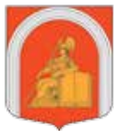
ГЕРБ МО АКАДЕМИЧЕСКОЕ

Статья 47.1. Нарушение порядка официального использования официальных символов внутригородских муниципальных образований Санкт-Петербурга и (или) публичное проявление неуважения к официальным символам внутригородских муниципальных образований Санкт-Петербурга